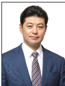
広島東洋カープ 緒方 孝市 元監督

「カープ県」特設サイト： https://baseball.skyperfectv.co.jp/carpken/