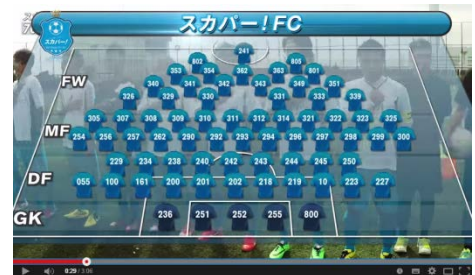
「スカパー! FC」の 70 人フォーメーション なんと、キーパーは 5 人!

スカパー! 「10 日間無料放送」は、未加入の方が普段観られないチャンネルを楽しむチャンスです。この機会にぜひ、多くの方にスカパー! をお楽しみいただければと思います。