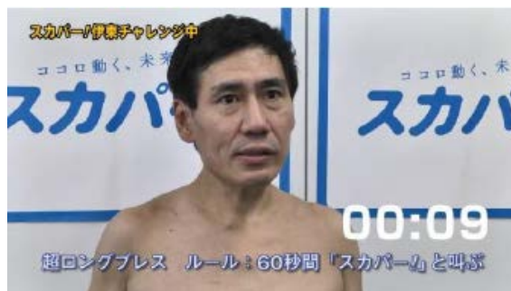
「超ロングブレス」にチャレンジする “スカパー! 伊東”