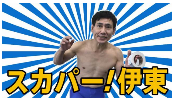
改名した“スカパー! 伊東”