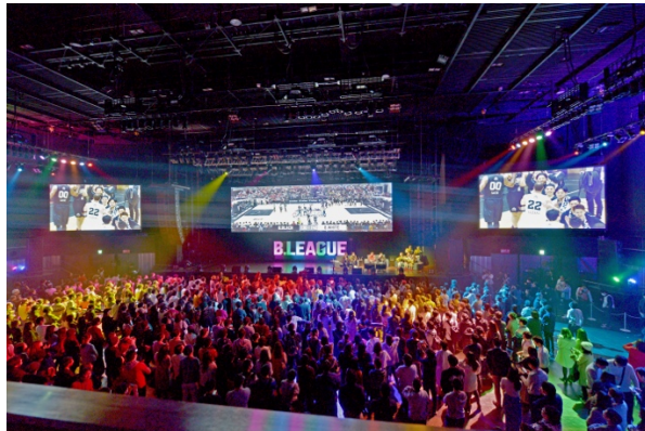
中央スクリーンが 32:9 ワイド映像