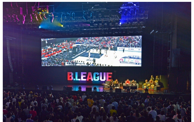
中央の 32:9 スクリーン